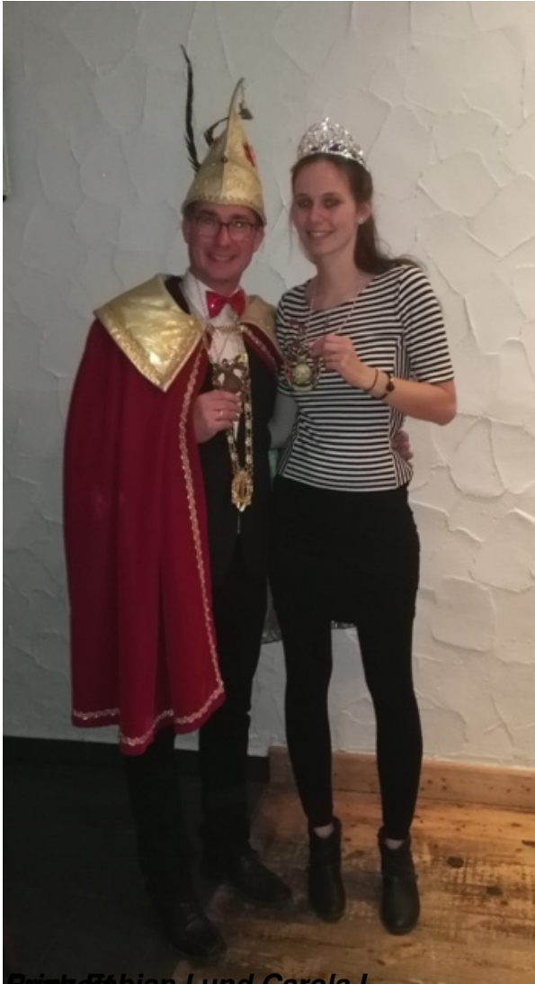
Punadiabian I und Carola I